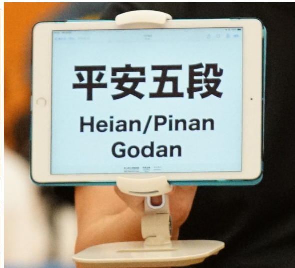
ipadによる形名の掲示