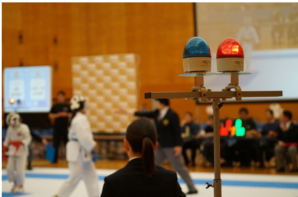
審判員の「ヤメ！」と同時に赤ライトが点灯

組手の競技中、審判員が「ヤメ！」と合図の音を出すのと同時に、赤いライトが点滅します。これによってろう者も聴者もハンディなしに対等に試合に臨むことができます。