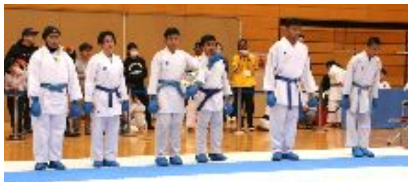
マレーシアチーム